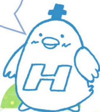
北部病院キャラクター、ほくピー